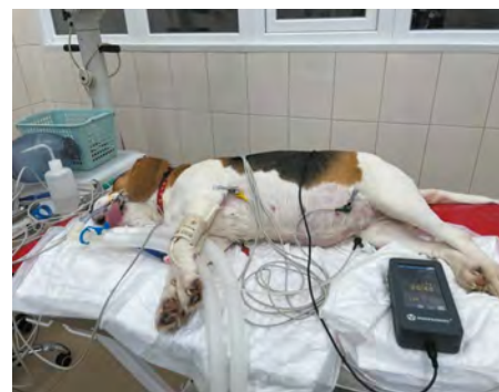
Фото 1. Подключение животного к контуру наркозно-дыхательного аппарата.

По степени воздействия на организм лекарственный препарат «Изофлуран» относится к веществам умеренно опасным (3-й класс опасности по ГОСТ 12.1.007-76).